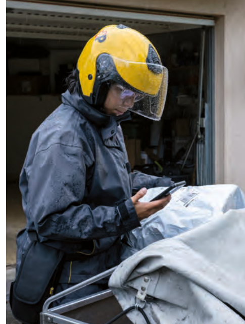
^ L'impiegata in logistica usa il suo scanner per segnalare che il pacco non è stato consegnato.

Il carico di lavoro varia notevolmente a seconda della stagione. «A novembre e dicembre, ad esempio, con il Black Friday e le festività di fine anno, distribuiamo molti pacchi. In estate, invece, il ritmo è più tranquillo e la mia giornata spesso finisce nel primo pomeriggio», precisa la giovane, che lavora anche due sabati al mese.