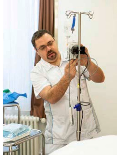
▲ Les sages-femmes préparent le matériel nécessaire à un accouchement.

«Nous travaillons douze heures d'affilée. Cela nous permet, dans la mesure du possible, d'éviter les changements d'équipe durant un même accouchement et de suivre les parturientes jusqu'à la naissance de leur enfant. Il est essentiel de créer un lien de confiance afin de pouvoir rassurer nos patientes», souligne ce professionnel. «C'est d'autant plus important en cas de complication: si une césarienne s'avère nécessaire, cette confiance permet aux parents de vivre cette