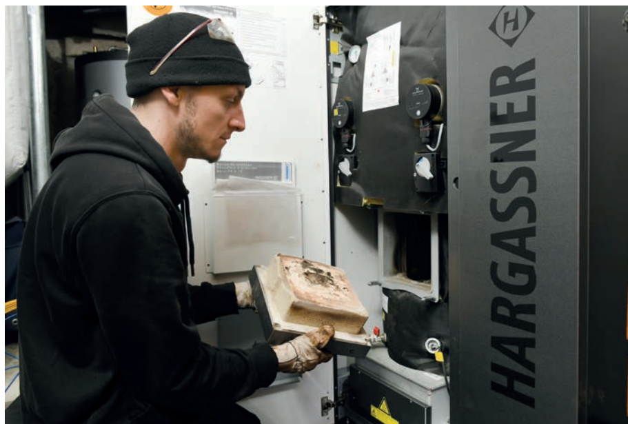
^ Aujourd'hui, les ramoneurs et ramoneuses travaillent généralement sur des installations modernes et efficaces.