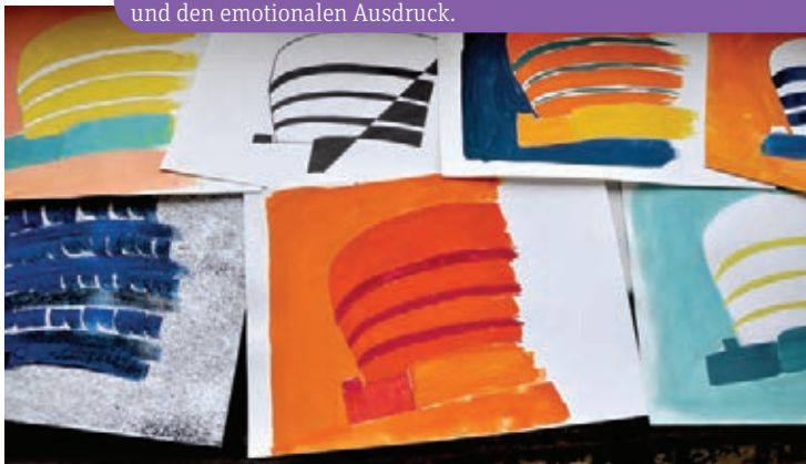
Formen und Farben: Das gleiche Motiv in verschiedenen Formen und mit verschiedenen Techniken zu zeichnen, ist eine grosse Herausforderung.