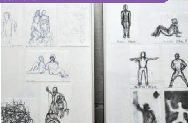
Skizzen von Menschen: Bei Menschen (und Tieren) geht es nicht nur um die Formen, sondern auch um Bewegungen, Haltungen und den emotionalen Ausdruck.