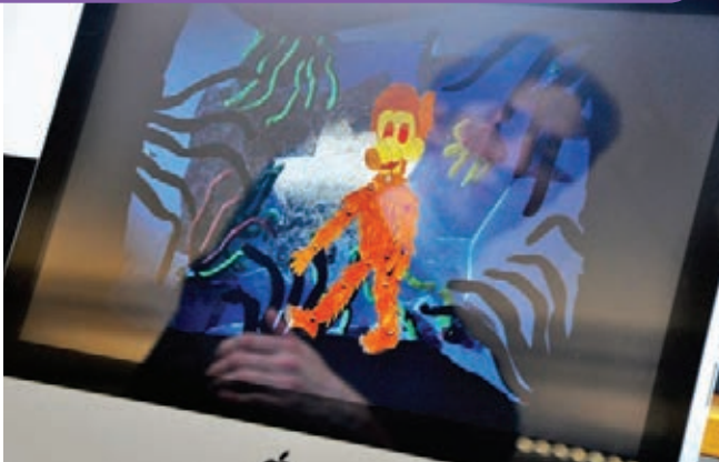
Animationen: Figuren werden in verschiedenen Posen fotografiert. Die Bilder werden dann zu einem Film zusammengefügt. So entstehen Animationen.