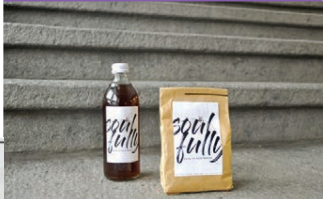
Eigene Schriften: Neue Schriften werden mit Hilfe von Rastern aus Rechtecken und Rauten entworfen oder in einem freien Gestaltungsprozess von Hand gezeichnet.